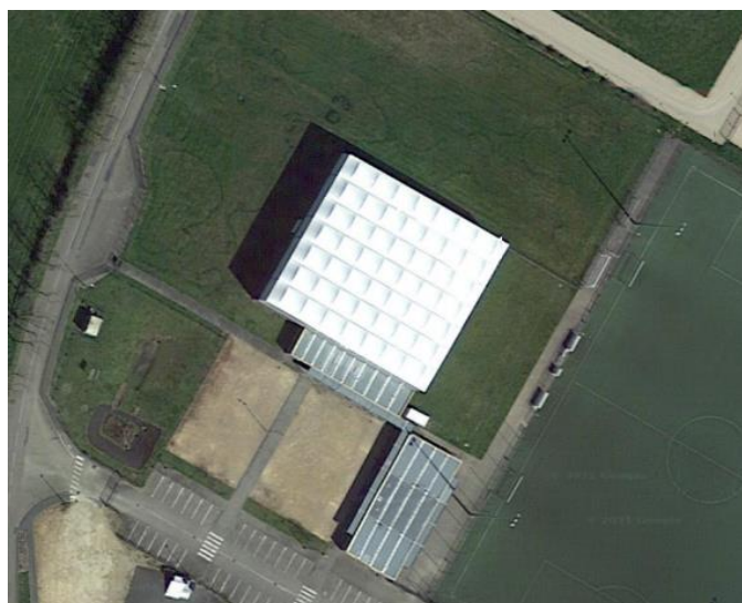
Figure 4 – Vue aérienne centre sportif ST-DIDIER-SUR-CHALARONNE