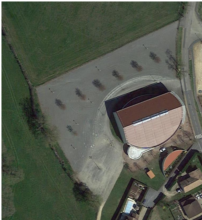
Figure 6 – Vue aérienne parking gymnase ST-DIDIER-SUR-CHALARONNE