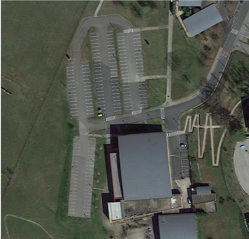
Figure 5 – Vue aérienne complexe VISIOSPORT MONTCEAUX