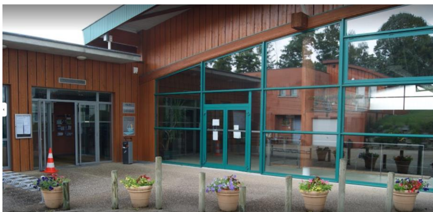
Figure 1 – Siège de la Communauté de Communes Val de Saône Centre

Une procédure de sélection est mise en œuvre pour l'octroi d'une Autorisation d'Occupation Temporaire (AOT) sur le Domaine Public de la Communauté de Communes Val de Saône Centre sur les toitures du centre sportif de ST-DIDIER-SUR-CHALARONNE et du complexe VISIOSPORT de MONTCEAUX ainsi que sur les parkings du gymnase de ST-DIDIER-SUR-CHALARONNE et du complexe VISIOSPORT de MONTCEAUX.